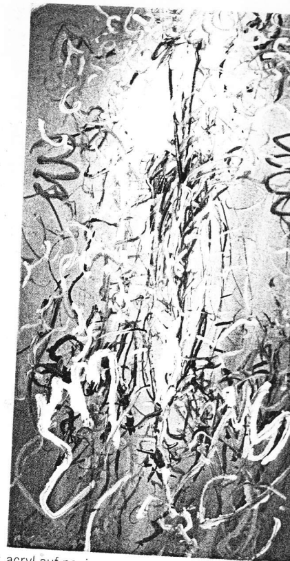
acryl auf papier 210 cm mal 120 cm